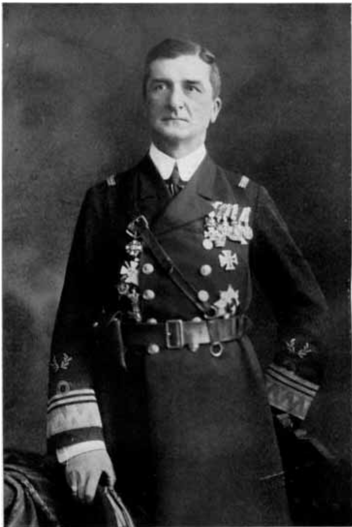
Horthy Miklós tengernagy

kok bujkáltak. A nyitott ablak kiverődő világosságában pedig levett kalappal szomszédok álltak. Ők is imádkoztak.