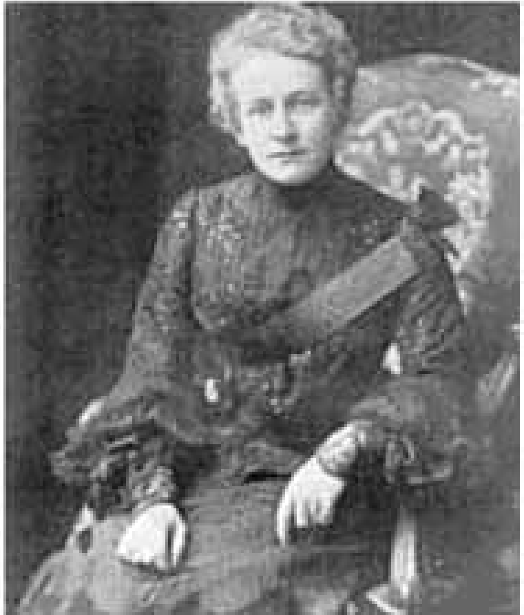
Tormay Cécile (1876-1937)