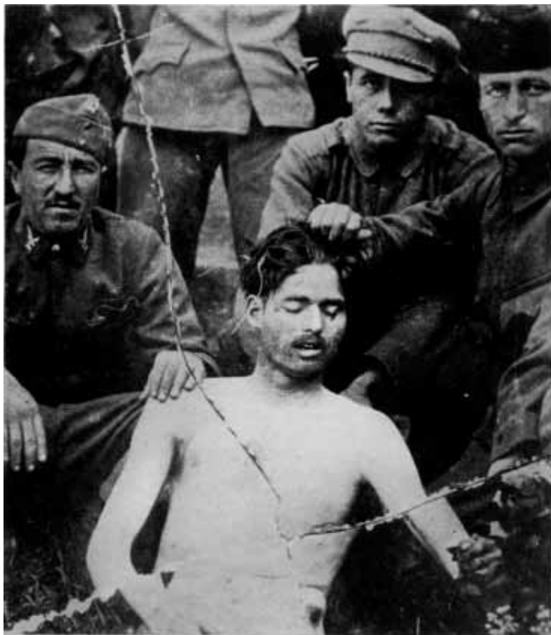
A Lenin-fiúk egyik áldozatukkal fényképeztetik magukat

egyedül maradtam, megkíséreltem, fel tudnék-e könyökölni a párnán. Két nap múlva utaznom kell. Visszaestem.