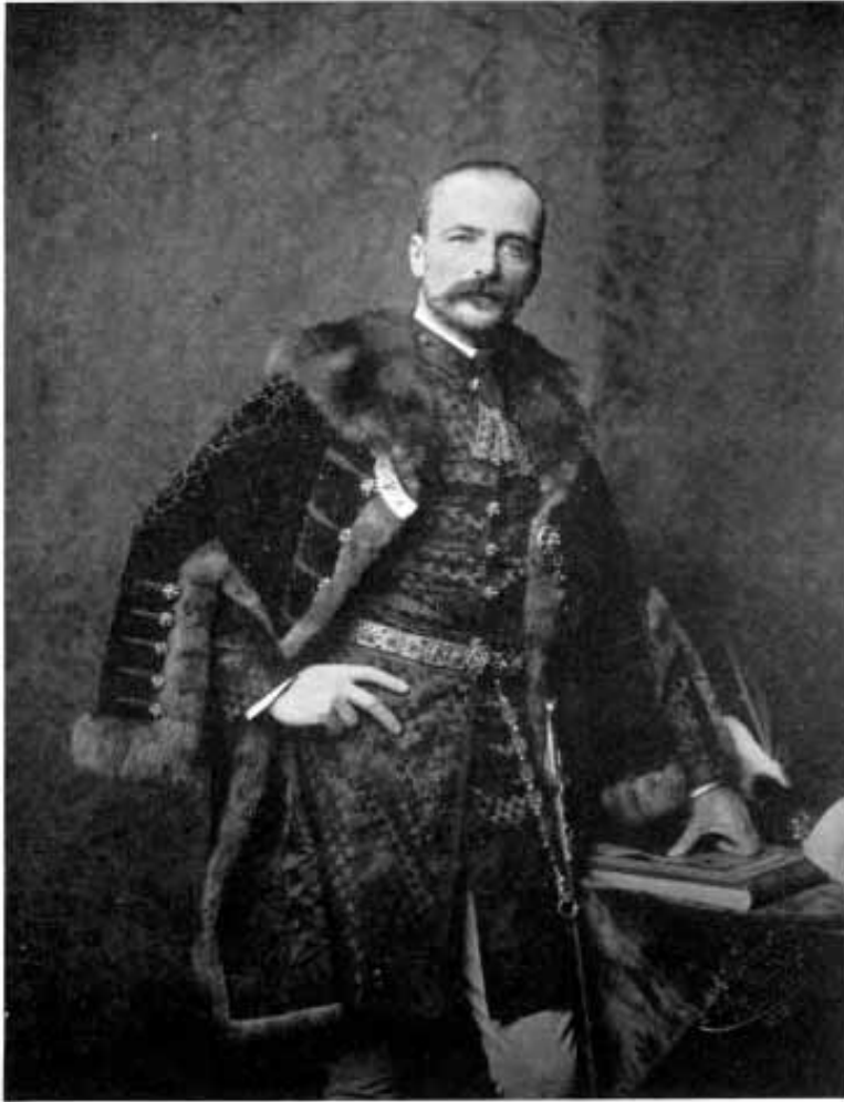
Tisza István gróf

A telefonközpont szétkapcsolt. Egy idő múlva érezni kezdem a megszelt fal hidegét a hátamon. Csak ekkor vettem észre, hogy támaszkodom, hogy a fejemet is nekitámasztottam a falnak.