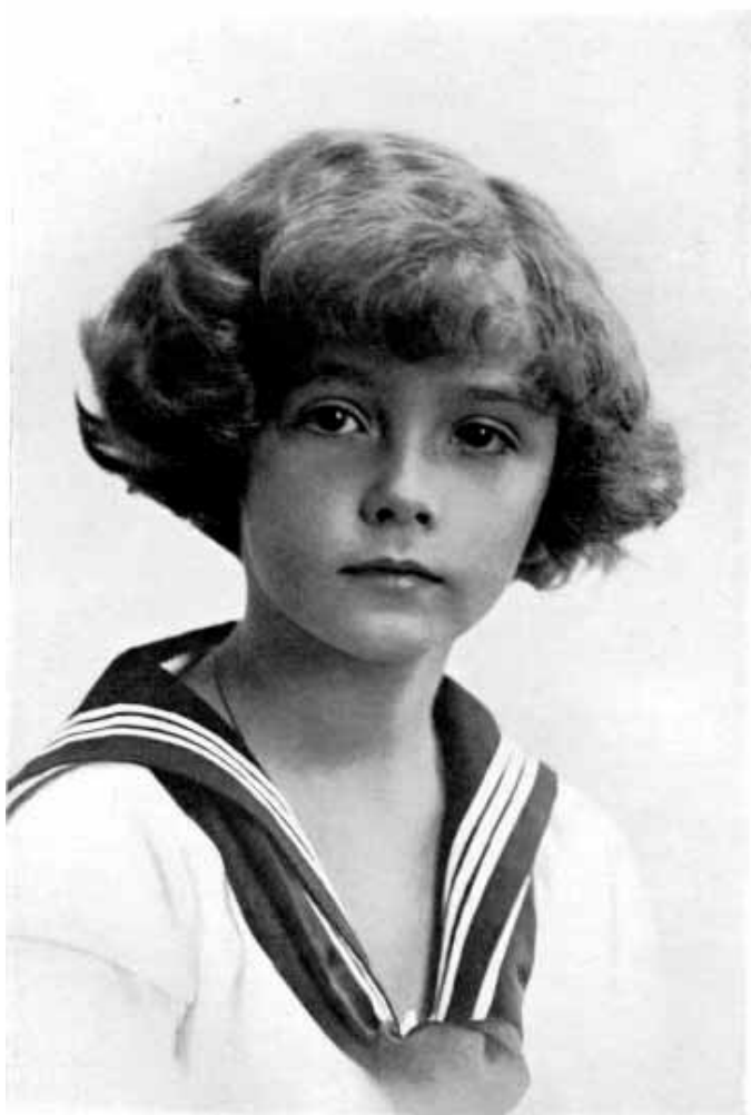
Ottó koronaherceg - Magyarország törvény szerinti királya

– Éljen a forradalom, éljen a spritzer... Lealázóan undorító volt az egész. Menekülni szerettem volna, hogy ne lássak, ne halljak semmit. Haza vágyódtam. Haza, a hűvösvölgyi házba, az erdők fölött, a hegyek közé.